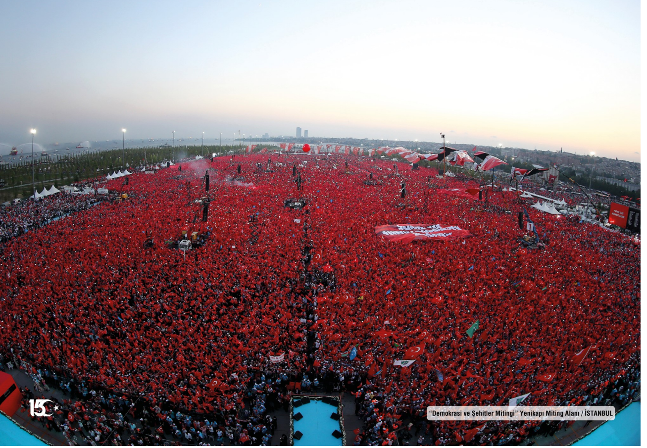
"Demokrasi ve Şehitler Mitingi" Yenikapı Miting Alanı / İSTANBUL